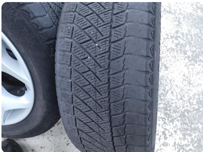
2.6 Skjev slitasje på vinterdekk