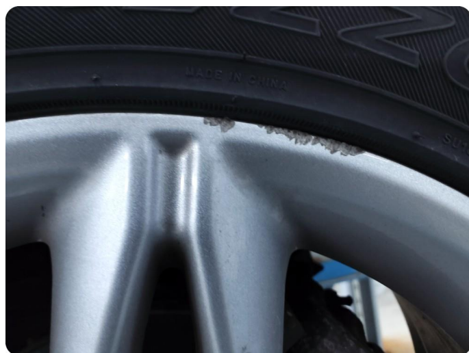
2.8 Kantkjørt felg Sommer felger