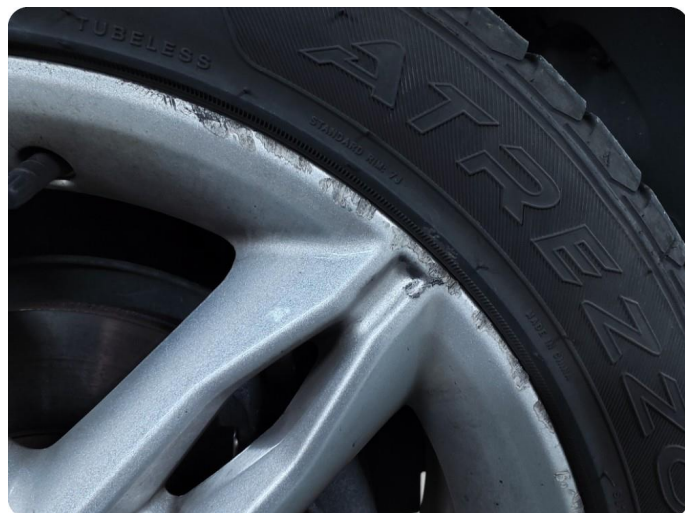
2.8 Kantkjørt felg Sommer felger