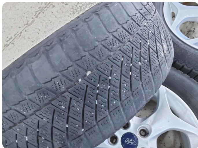
2.6 Skjev slitasje på vinterdekk