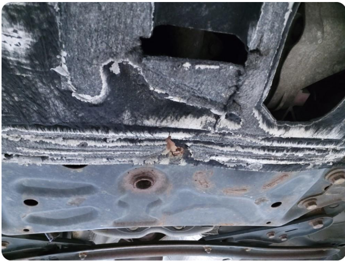
2.1 Beskyttelsesplate skadet/mangler