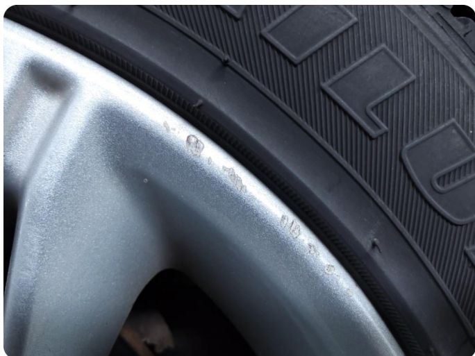
2.8 Kantkjørt felg Sommer felger