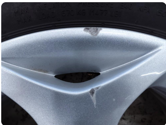
2.7 Kantkjørt felg Vinter felg