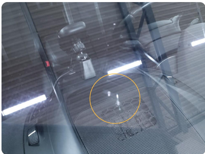
2.9 Steinsprut med sprekk